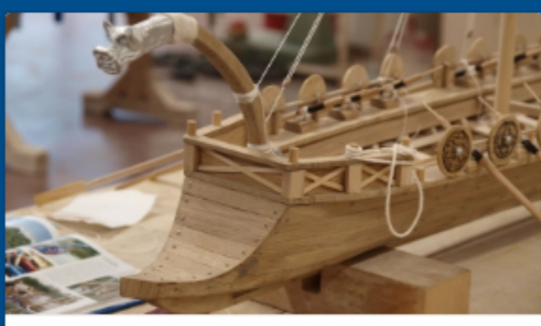
Architektur-Modellbauprojekt: Bauzeichner erleben „Navis Lusoria“...