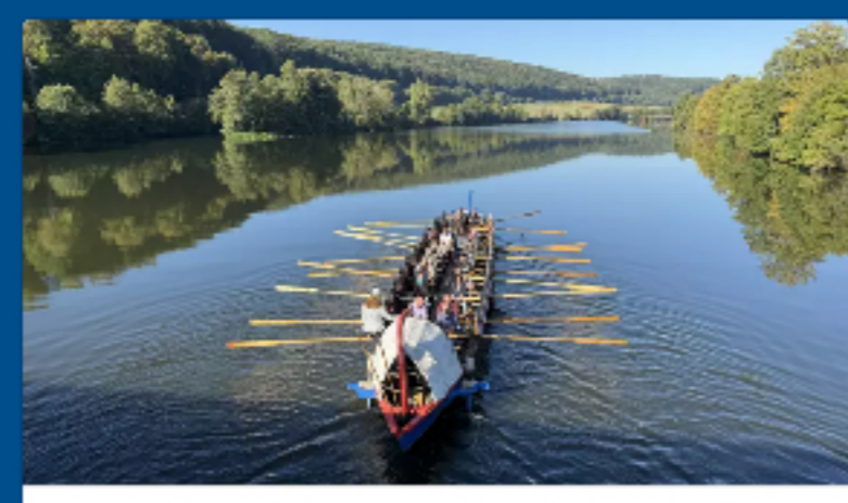
Perfektes Sommerfinale: Bauzeichner des BFW erleben Exkursion auf der „Regina...“