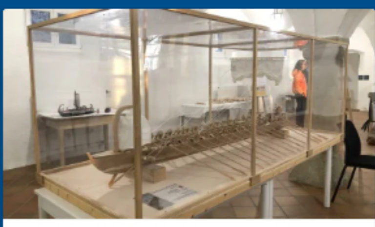
Architekturmodellbau trifft Römerschiff – Nachbau einer spätrömischen Galeere...