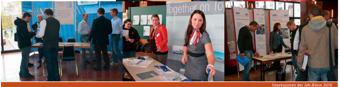
Impressionen der Job-Börse 2010

Wir danken allen unseren Geschäftspartnern und Freunden für die vertrauensvolle Zusammenarbeit und wünschen ein gesegnetes Weihnachtsfest und ein erfolgreiches Jahr 2011.